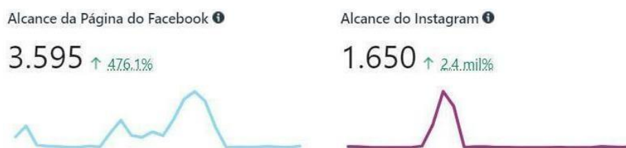
Gráfico 3 - Resultados de Alcance totais das páginas após as duas campanhas patrocinadas

A seguir, encontra-se o alcance obtido nas páginas da empresa após as campanhas patrocinadas.