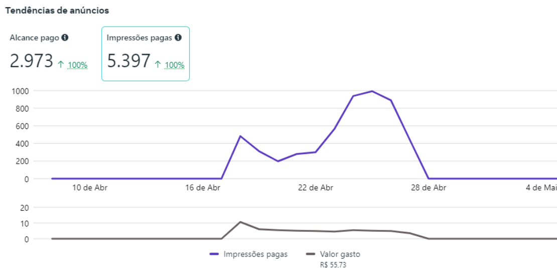
Gráfico 2 - Resultados da métrica de impressões das duas campanhas patrocinadas

No próximo gráfico é possível identificar o número de impressões que se refere ao número total de visualizações do anúncio que impactou as mesmas pessoas.