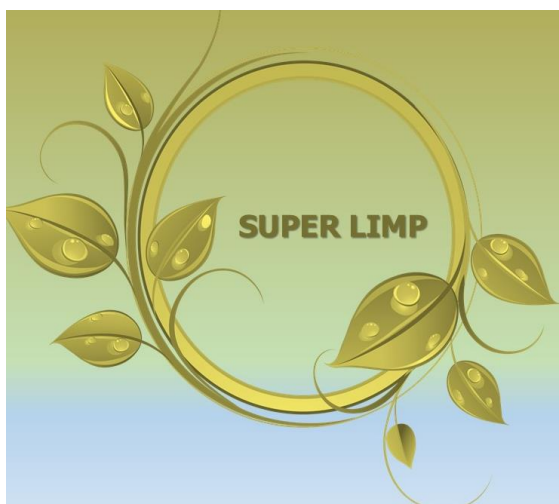
Figura 02 – Logo – Super Limp.

Ainda pautando a qualidade do produto, foi desenvolvido um logotipo para a marca que transmite os ideais de conservação ambiental que o negócio pretende alcançar, transmitindo leveza aos consumidores com cores leves e bem distribuídas na imagem, no caso representada por uma estilização do planeta Terra e uma fonte de escrita divertida e moderna. A embalagem do produto consistira em um pacote plástico reciclado com um impresso contendo o logo, a composição do produto e uma mensagem da equipe Super Limp para seus consumidores.