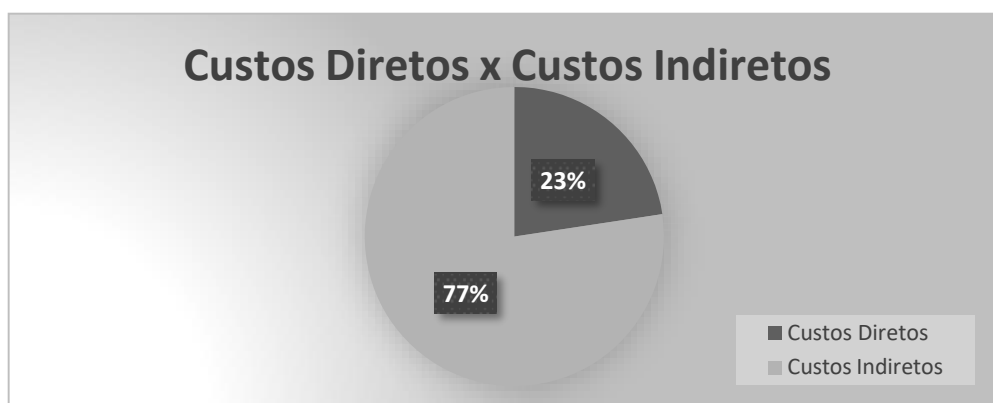
Gráfico 2 - Custos Diretos x Custos Indiretos