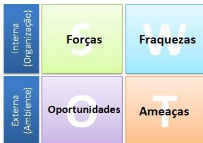
Figura 1 – Matriz SWOT